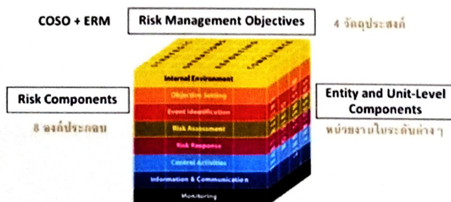
รูปภาพ ๑ องค์ประกอบในการบริหารความเสี่ยงตามมาตรฐาน COSO ERM Intergrated Framework

องค์การบริหารส่วนตำบลสะอาดไชยศรี ได้แต่งตั้งแต่งตั้งคณะทำงานผู้รับผิดชอบการบริหารจัดการความเสี่ยงองค์การบริหารส่วนตำบลสะอาดไชยศรี และดำเนินการโดยมีขั้นตอนการดำเนินการ หลักเกณฑ์ในการวิเคราะห์ประเมินและจัดการความเสี่ยงอย่างเหมาะสม ตามกระบวนการบริหารความเสี่ยงตามมาตรฐาน COSO (Committee of Sponsoring Organization of the Tread Way Commission) มาตรฐานที่จะนำมาใช้ในการกำหนดแนวทางการบริหารความเสี่ยง เป็นกรอบแนวคิดในการบริหารความเสี่ยงแบบทั่วทั้งองค์กร (Enterprise Risk Management : ERM) มีแนวทางในการแจกแจงปัญหา และความเสี่ยงออกเป็นองค์ประกอบย่อยๆ รวมถึงมีการกำหนดบทบาทและหน้าที่ความรับผิดชอบด้านการบริหารความเสี่ยงที่ชัดเจน